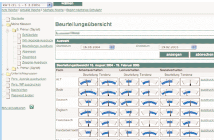
■ Abb. 3 Beurteilungsübersichten aus Sicht der Lehrperson